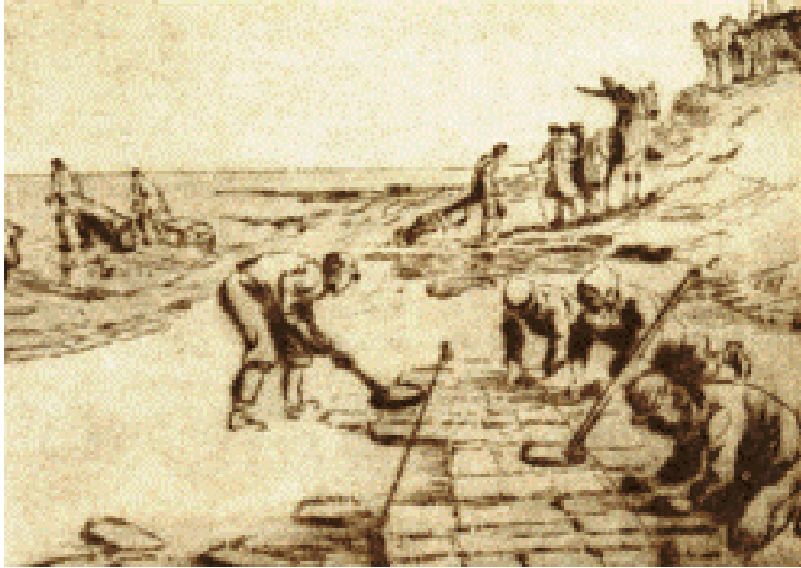
ECCE OPERA STRAMENTICIA QUIBUS AGGER PROTEGITUR Pinxit Alexander Eckener.

Olaus autem servus maior non cessabat nuntium diffundere quam latissimê, ut apud illos homines odium concitaret Hauci eiusque patris quoque, qui non potuit, quin culpae particeps fieret; alii autem, ad quos res non spectabat, aut quibus cordi erat rerum gerendarum diligentia, ridebant gaudentes, quod iuvenis animum senis fatigatum aliquatenus refocillasset. »Dolendum quidem est« inquiunt, »quod iste catulaster est parum locuples 1 ; alioquin fieret aliquando talis comes aggeralis, quales fuere priores; at pauca ista iugera patris parum sufficiunt 2 !«.